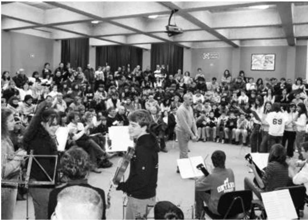
Un momento del concerto che si è tenuto alla scuola "Griffini" contestualmente alla presentazione del calendario

■ Un calendario multiculturale per un futuro migliore. Questo è stato l'augurio espresso da tutti i numerosi presenti alla cerimonia ufficiale di presentazione del calendario multiculturale 2007, realizzato dalla consultazione dell'immigrazione del comune con l'apporto dei ragazzi del terzo anno del corso di operatore grafico addetto pre-stampa del Centro formativo professionale (Cfp) e con il patrocinio dell'amministrazione. Il calendario presenta in dodici fotografie altrettanti mesi di integrazione e di convivenza di ragazzi delle scuole materne, elementari e medie inferiori provenienti da diversi Stati e regioni del mondo. Le foto sono accompagnate da suggestive frasi di personaggi come Ghandi, Einstein, Madre Teresa di Calcutta, William Shakespeare, Eleanor Roosevelt, James Feni-